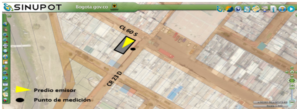
Figura 1. Ubicación del predio emisor y punto de medición.